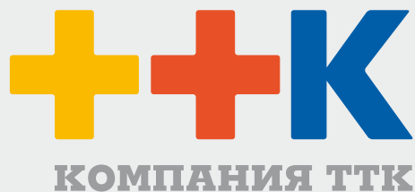
Стандартный вариант (на русском языке)

Стандартный полноцветный вариант логотипа применяется в большинстве коммуникаций: в печатных материалах, на интернет-страницах, постерах, корпоративной документации и некоторых фирменных подарках. Если не указано иного, следует использовать именно этот вариант. В некоторых случаях приходится использовать менее приоритетный полноцветный вариант логотипа – с белым дескриптором.